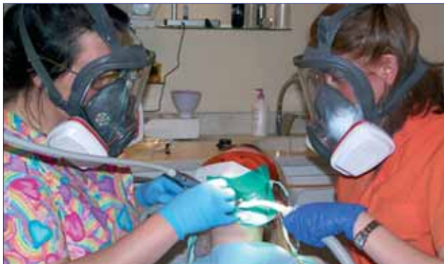
Intervención para la retirada de una amalgama de plata.

nal sea bueno, y al contrario. Pasa con todas las especialidades, hay odontólogos que cuelgan el cartel de ortodoncista porque han hecho un curso y, sin embargo, no son buenos.